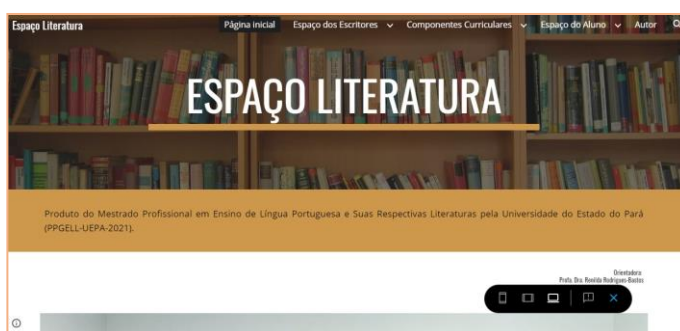
Imagem 1: Página Inicial