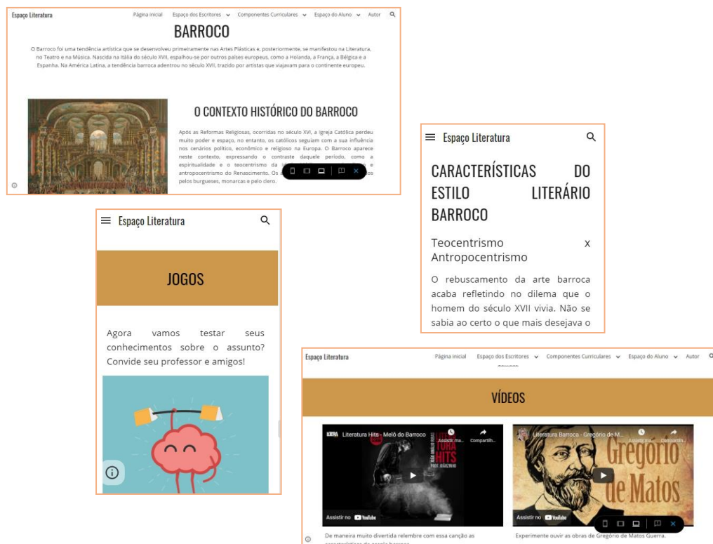
Imagem 3: Recortes da aba Barroco , inserida em 1º Ano (E. Médio) , Componentes Curriculares 3 .