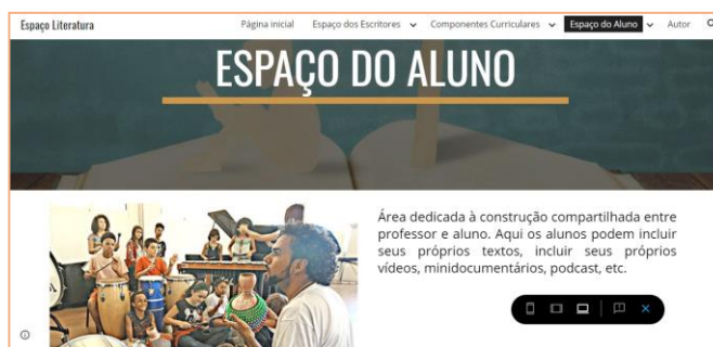
Imagem 4: Recorte da aba Espaço do Aluno .