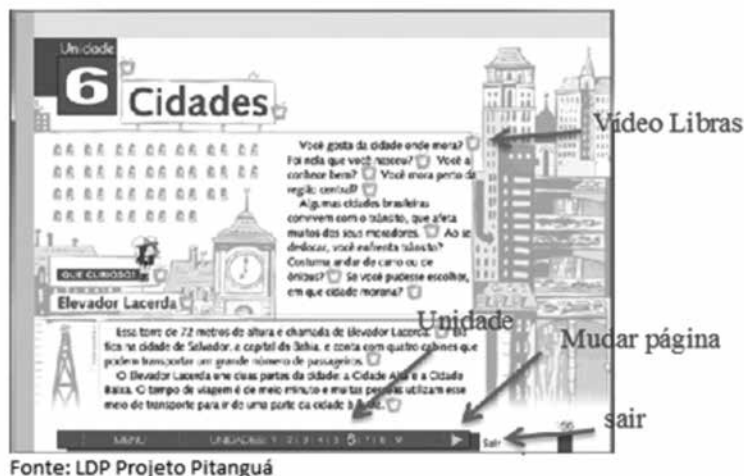
Figura 3: Links presentes no livro

Durante o período de produção de dados, foi observado como o professor faz uso deste material; de que forma ele utilizou desde para que os alunos conseguissem avançar nos conhecimentos da L2; e as outras estratégias criadas a partir do LDP para que o aluno aprendesse; além disso observamos o processo de geração, transmissão e assimilação de conhecimentos por parte dos professores e dos estudantes surdos com o uso do Kit Didático.